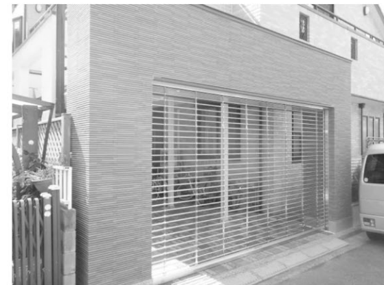
I邸ガレージ改修工事